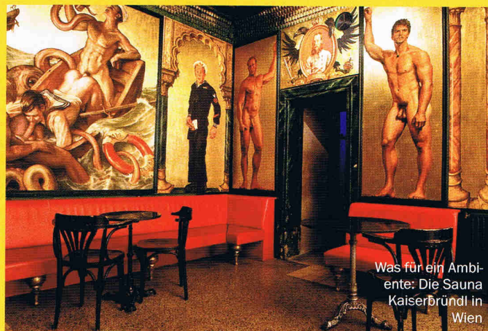
Was für ein Ambiente: Die Sauna Kaiserbründl in Wien

Immer noch eines der beliebtesten Reiseziele schwuler Deutscher – und das nicht nur wegen der Dünen: Gran Canaria